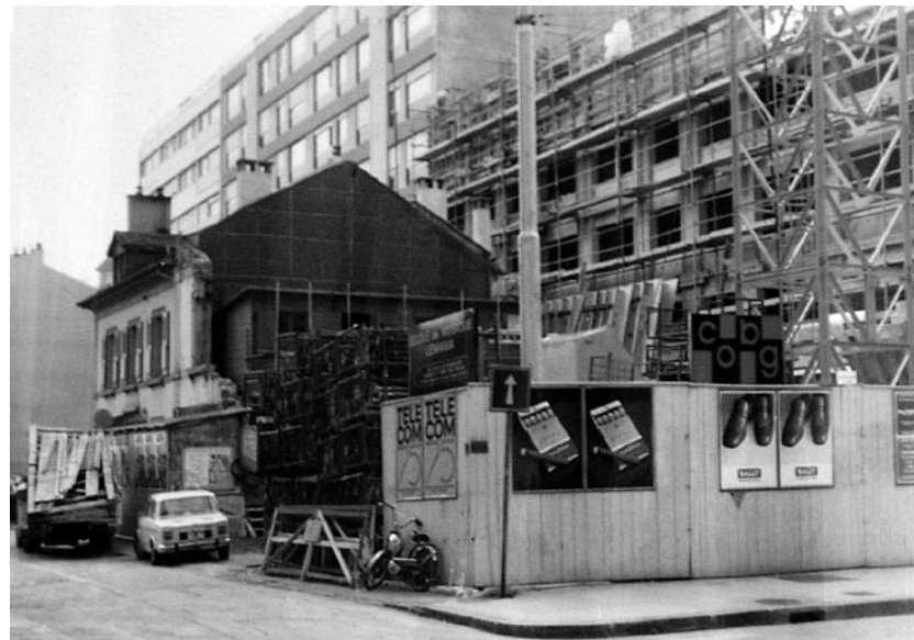
Vue du n° 6 de la rue Jean-Violette peu avant sa démolition; l'actuel n° 4 est en construction

Il n'a pas non plus connu GINO V., le propriétaire du n° 12 ; néanmoins, il nous raconte des anecdotes sur la maison ainsi que sur d'autres voisins.