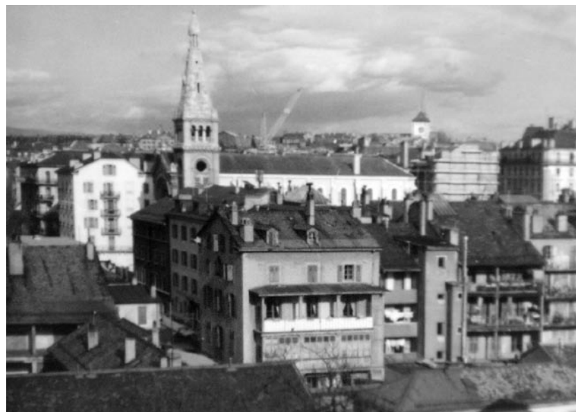
La façade arrière du n° 12 de la rue Jean-Violette vue depuis la rue Pré-Jérôme